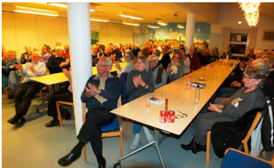
73 af foreningens medlemmer deltog i arrangementet, heraf flere der havde gjort tjeneste på Sandagergård.

Han øste rundhåndet af sin historiske viden, og vi gik alle berigede hjem fra en interessant foredragsaften.