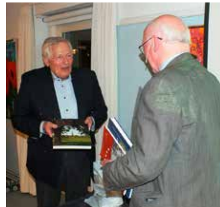
Som tak for det fine foredrag overrakte formanden lokale bøger, hvor ikke mindst "Amager i Krig og Fred" blev modtaget af foredragsholderen med stor interesse.