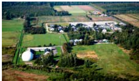
FE's store anlæg på Sandagergård ved Aflandshage, som er en betydelig arbejdsplads i Dragør Kommune.